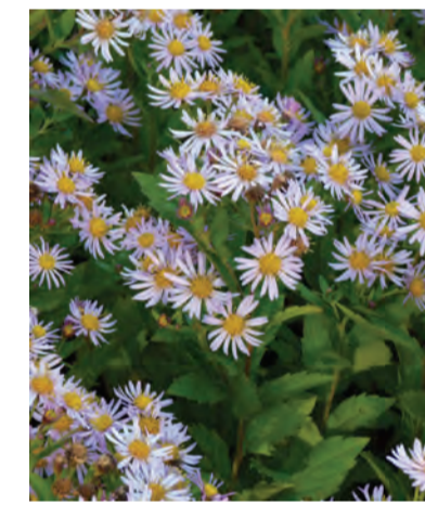
Aster ageratoides 'Asran' (herfstaster) Hoogte: 50-70cm Bloeit: augustus – november Standplaats: zon-halfschaduw