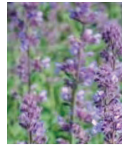
Nepeta faassenii 'Six Hills Giant' (kattekruid) Hoogte: 50-100cm Bloeit: mei-september Standplaats: zon-halfschaduw