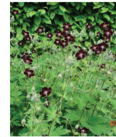
Geranium phaeum Hoogte: 50 cm Bloeit: mei-juli Standplaats: zon-halfschaduw-schaduw