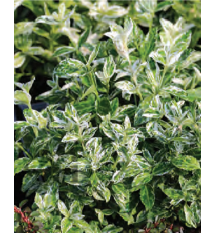
Euonymus fortunei 'Harlequin' (kardinaalsmuts) Wintergroen Hoogte: 150cm Hoogte: 50cm Standplaats: zon-halfschaduw