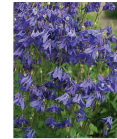
Aquilegia vulgaris (wilde akelei) Hoogte: 60cm Bloeit: juli-september Standplaats: halfschaduw-schaduw