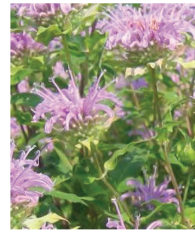
Monarda fistulosa (wilde bergamot) Hoogte: 50-80cm Bloeit: juli-september Standplaats: zon-halfschaduw