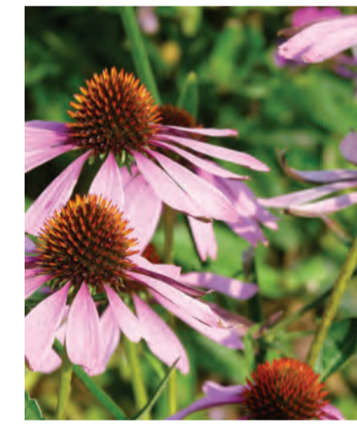
Echinacea purpurea 'Leuchstern' (zonnehoed) Hoogte: 80-100cm Bloeit: juli-september Standplaats: zon-halfschaduw