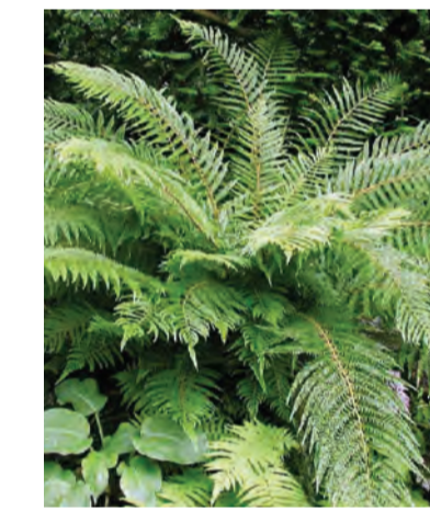
Polystichum setiferum Hoogte: 50-90cm Wintergroen Standplaats: halfschaduw-schaduw