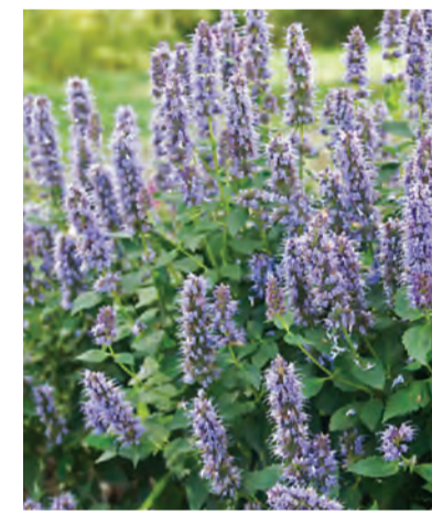
Agastache 'Blue Fortune' (dropplant) Hoogte: 80-100cm Bloeit: juli-september Standplaats: zon-halfschaduw