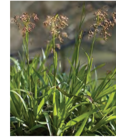
Luzula sylvatica (grote veldbies) Hoogte: 30-40cm Bloeit: april-juni Standplaats: halfschaduw-schaduw