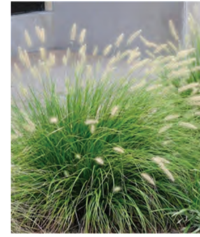
Pennisetum alopecuroides 'Little Bunny' (lampenpoetsersgras) Hoogte: 30-40cm Bloeit: augustus-oktober Standplaats: zon-halfschaduw