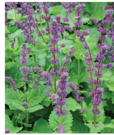
Salvia verticillata 'Purple Rain' (kranssalie) Hoogte: 30-50cm Bloeit: juni-augustus Standplaats: zon-halfschaduw