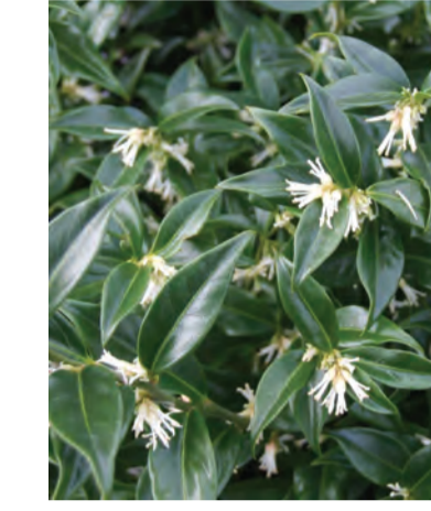
Sarcococca hookeriana 'Humilis' Hoogte: 70cm Wintergroen Standplaats: halfschaduw-schaduw