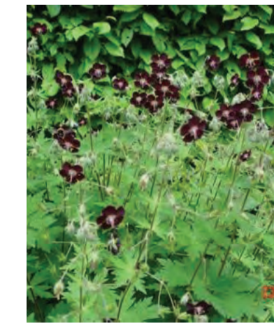
Geranium phaeum Hoogte: 50 cm Bloeit: mei-juli Standplaats: zon-halfschaduw-schaduw