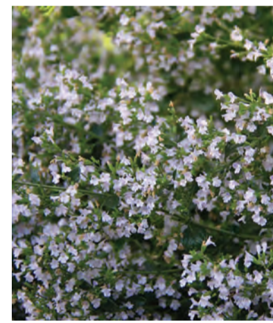
Calamintha nepeta (bergsteentijm) Hoogte: 30-50cm Bloeit: juli-september Standplaats: zon-halfschaduw