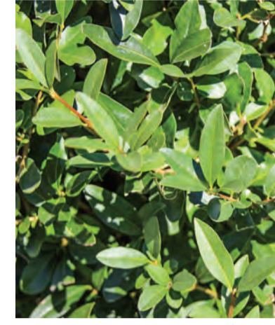
Ligustrum vulgare 'Lodense' (dwergliguster) Wintergroen Hoogte: 150cm Standplaats: zon-halfschaduw