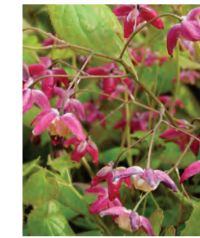
Epimedium x rubrum Hoogte: 30cm Bloeit: februari-april Standplaats: halfschaduw-schaduw