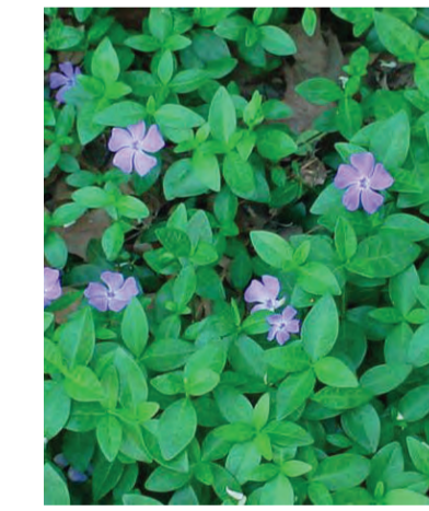
Vinca minor (kleine maagdenpalm) Hoogte: 15cm Bloeit: april – juni Standplaats: halfschaduw-schaduw