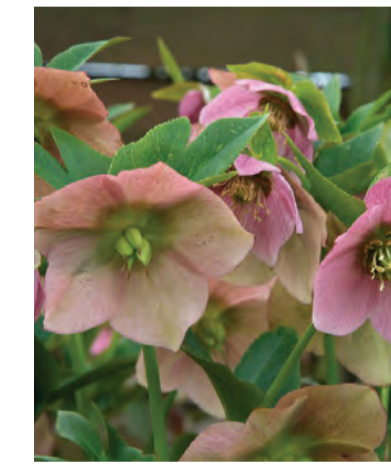
Helleboris orientalis (nieskruid) Hoogte: 30-40cm Bloeit: januari-april Standplaats: halfschaduw-schaduw