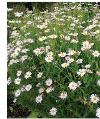
Kalimeris incisa (zomeraster) Hoogte: 50-70cm Bloeit: mei-augustus Standplaats: zon-halfschaduw