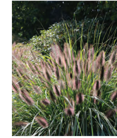
Pennisetum 'Viridescens' Hoogte: 60-80cm Bloeit: september – oktober Standplaats: halfschaduw-schaduw