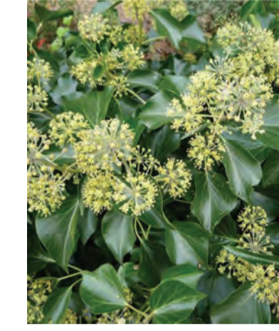
Hedera Helix 'Arborescens' (struiklimop) Wintergroen Hoogte: 150cm Standplaats: halfschaduw-schaduw