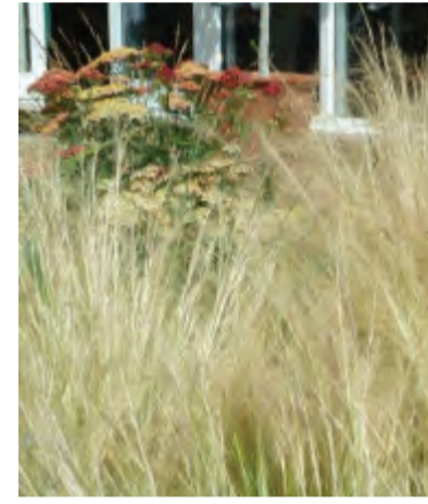
Stipa tenuissima (vedergras) Hoogte: 30-40cm Bloeit: juli-augustus Standplaats: zon-halfschaduw