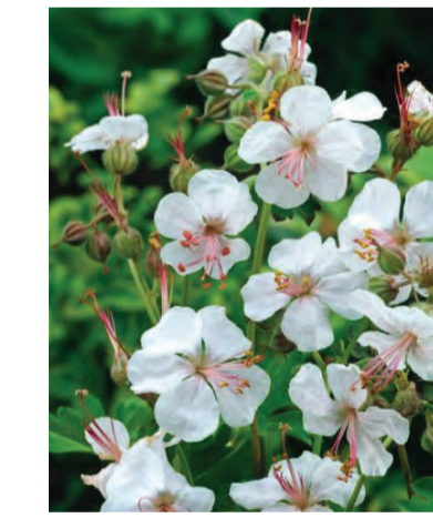
Geranium cantabrigiense 'Biokovo' (ooievaarsbek) Hoogte: 30cm Bloeit: juni-juli Standplaats: zon-halfschaduw--schaduw