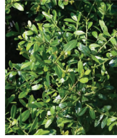
Ilex crenata 'Stokes' Wintergroen Hoogte: 40-80 Standplaats: zon-halfschaduw