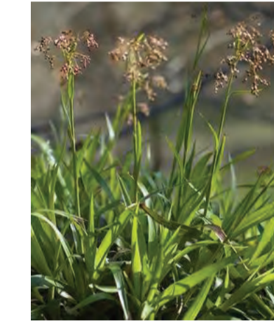
Luzula sylvatica (grote veldbies) Hoogte: 30-40cm Bloeit: april-juni Standplaats: halfschaduw-schaduw