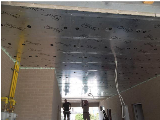
Effen garageplafond waar PIR platen tegen geplugd werden

Als de ruimte onder het plafond goed geventileerd wordt en dus minder vochtig is, is de materiaalkeuze ruimer, en komen ook EPS, PIR, kurk of zelfs minerale wol in aanmerking.