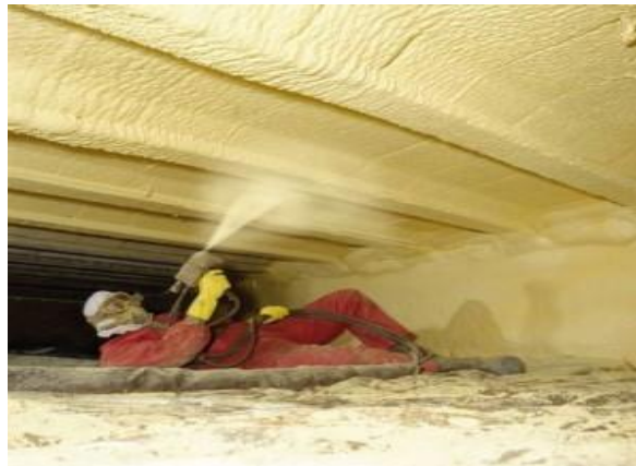
Gespoten isolatieschuim tegen booggewelven in kruipkelder (afbeelding: muurisolatie-info.be)

Wanneer het plafond zeer onregelmatig of moeilijk te bereiken is (bijvoorbeeld kruipkelder) en er worden geen eisen gesteld aan het uitzicht dan kan een gespoten isolatieschuim een laatste optie zijn. Er bestaan tegenwoordig isolatieschuimen op de markt die beweren minder giftige stoffen te bevatten dan het klassieke PUR schuim en zelfs voor een deel uit gerecycleerd materiaal bestaan (zoals PET flessen). Deze nieuwe schuimen zijn ook dampopen en bevatten enkel lucht in de cellen. De exacte samenstelling van deze nieuwe schuimen wordt helaas niet vrijgegeven waardoor de impact op milieu en gezondheid onduidelijk blijft.