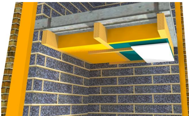
Effen plafond waar een verzorgde afwerking gewenst is (afbeelding: BAS Bouwen)

Wanneer een verzorgde afwerking van het plafond nodig is, raden we aan te werken volgens het principe zoals bij de houten roostering. Er wordt tegen het (effen) plafond een houten latwerk geplaatst op geregelde afstand en volgens de breedte van het isolatiemateriaal. Het latwerk is net zo hoog als de dikte van het isolatiemateriaal. De isolatie wordt tussen de balkenlaag geplaatst. Er wordt een (dampopen) folie geplaatst, waaronder een plafondlat wordt bevestigd. Deze zal dienst doen om elektriciteitsleidingen in het plafond te plaatsen en als bevestiging voor de afwerking in gipsvezelplaat of gipskartonplaat.